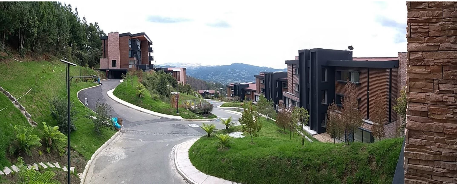
Foto Real Avance de obra