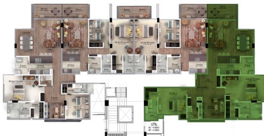
Planta segundo y tercer piso

ÁREA CONSTRUIDA | ÁREA PRIVADA 139.58mts 2 | 128.00mts 2