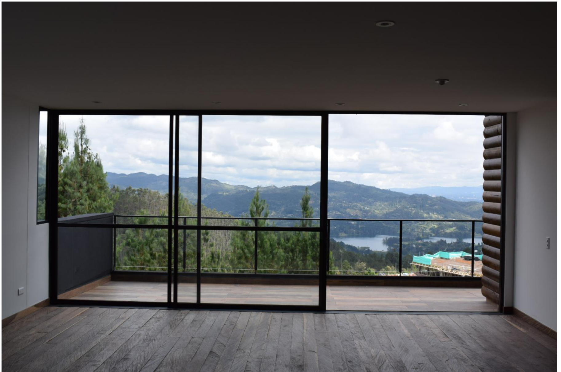
Foto Real Avance de obra