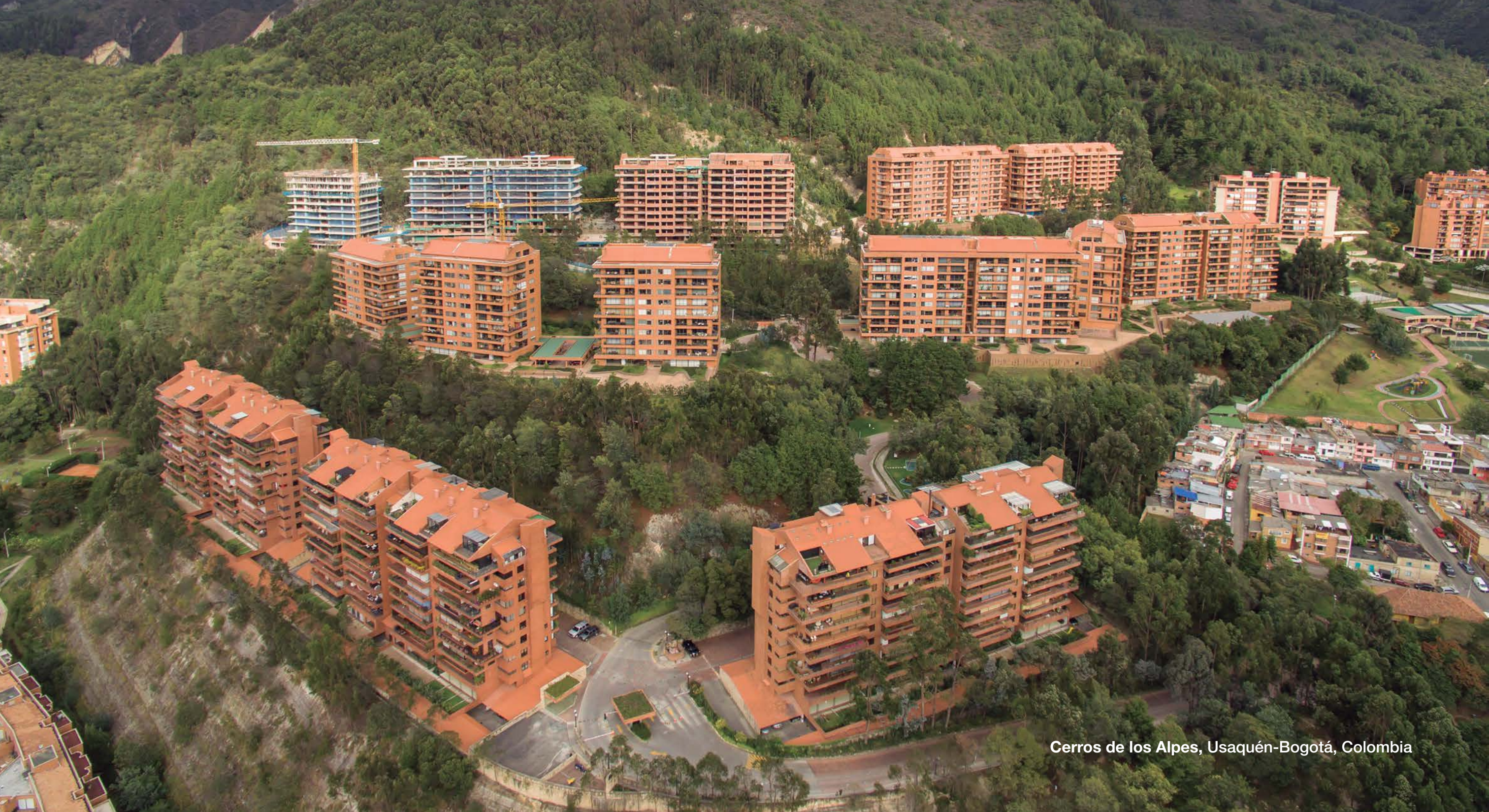
Cerros de los Alpes, Usaquén-Bogotá, Colombia