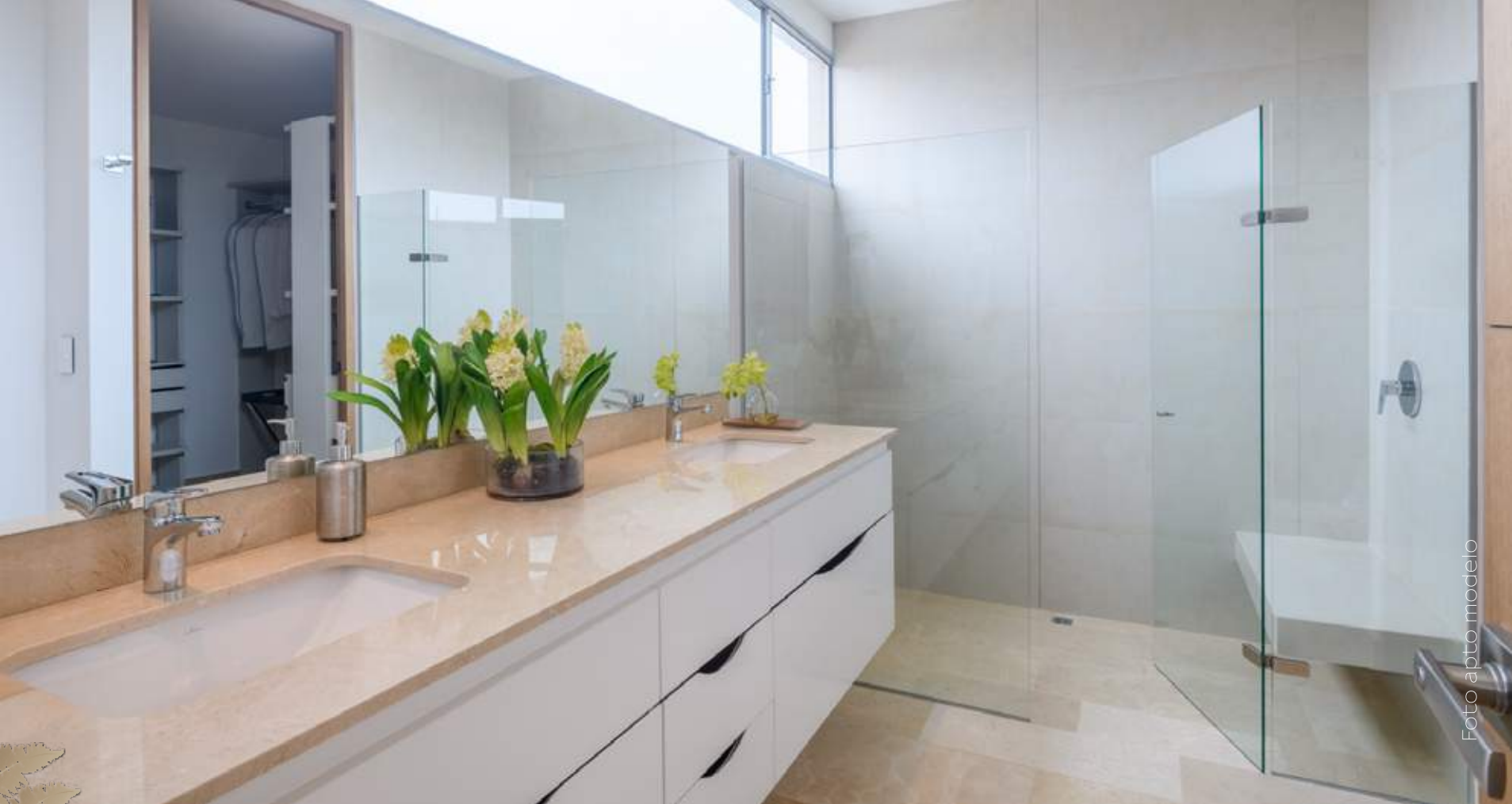
Foto apto modelo