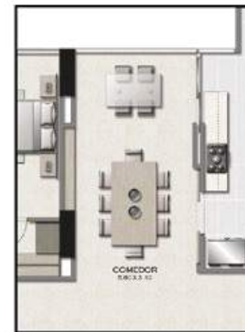
PLANTA APARTAMENTO 01 ÁREA TOTAL APARTAMENTO 215.80 M 2 PISOS 3, 4, 5, 6, 15, 16, 17, 18