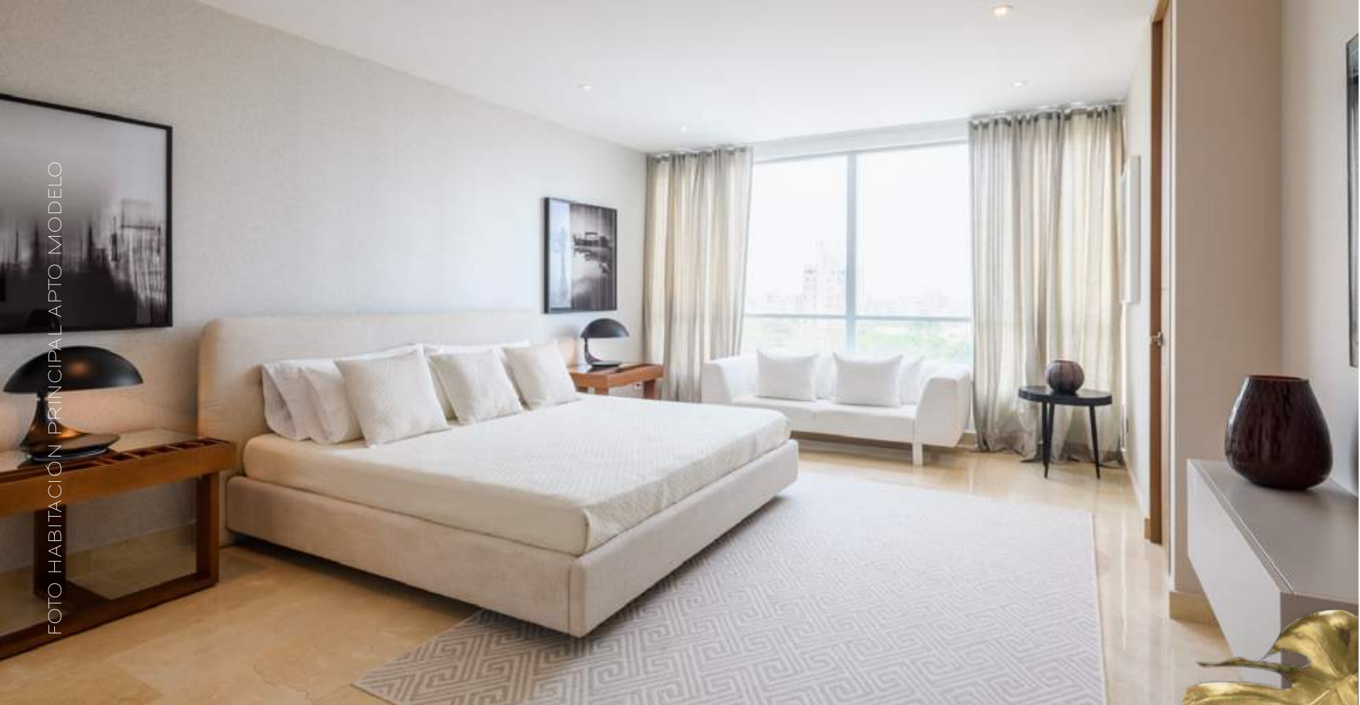
FOTO HABITACIÓN PRINCIPAL APTO MODELO

HABITACIONES AMPLIAS DONDE SOÑARÁS CON UN MEJOR MAÑANA