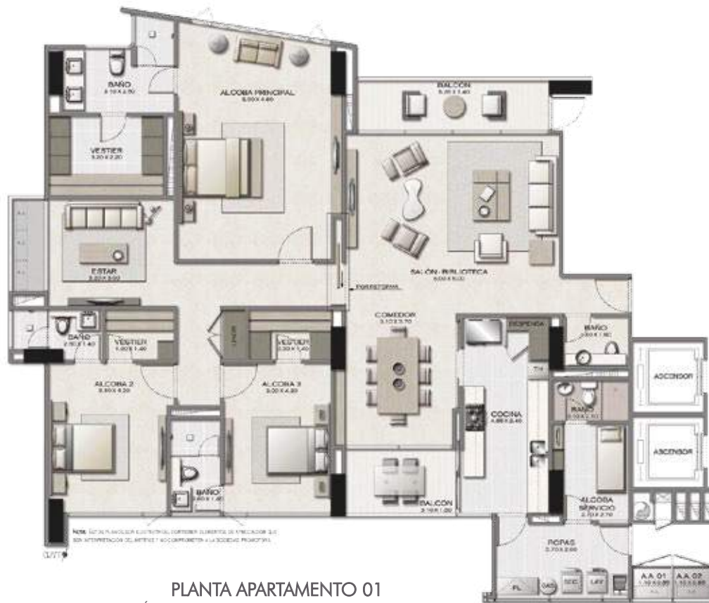
PLANTA APARTAMENTO 01 ÁREA TOTAL APARTAMENTO 215.60 M 2 PISOS 5, 7, 8, 9, 10, 11, 12, 13, 14