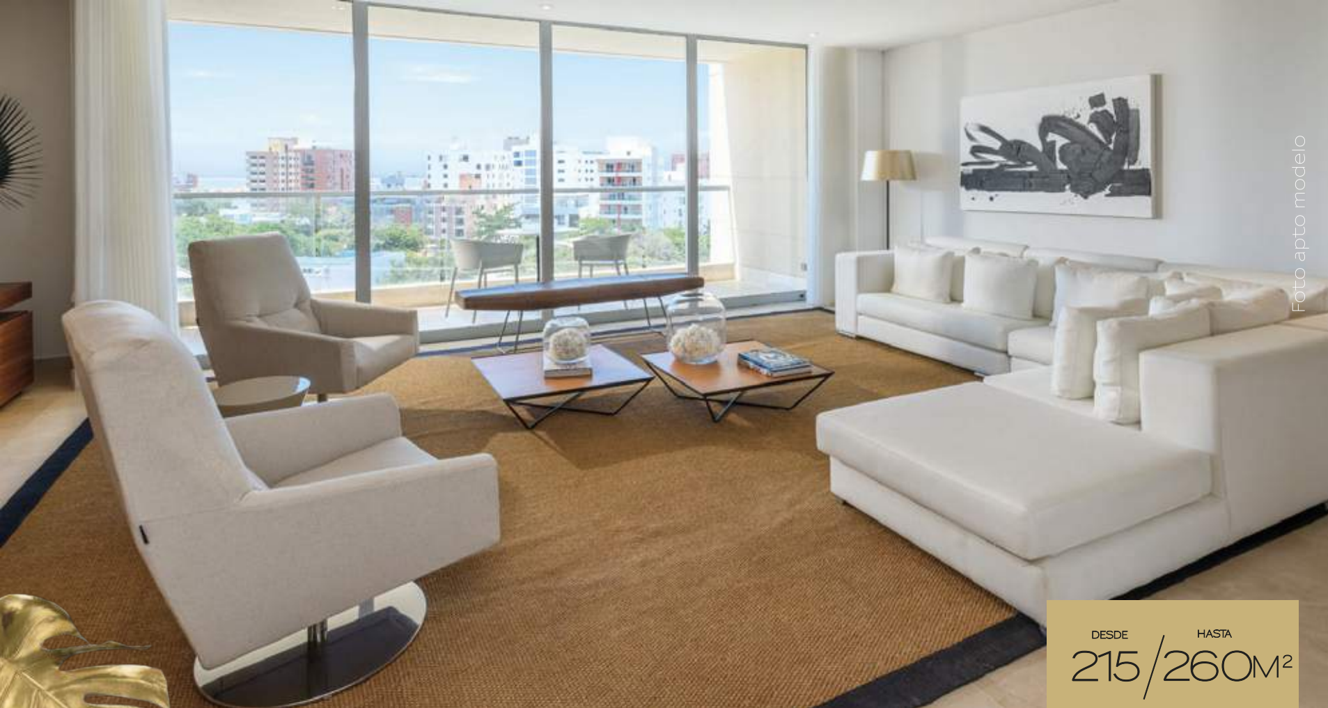
Foto apto modelo