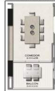
PLANTA APARTAMENTO 03 ÁREA TOTAL APARTAMENTO 251.60 M 2 PISOS 4, 5, 6, 7, 8, 9, 12, 13, 14, 15, 16, 17